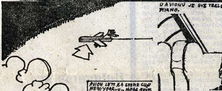
Hrvoje Vojković, 12 godina