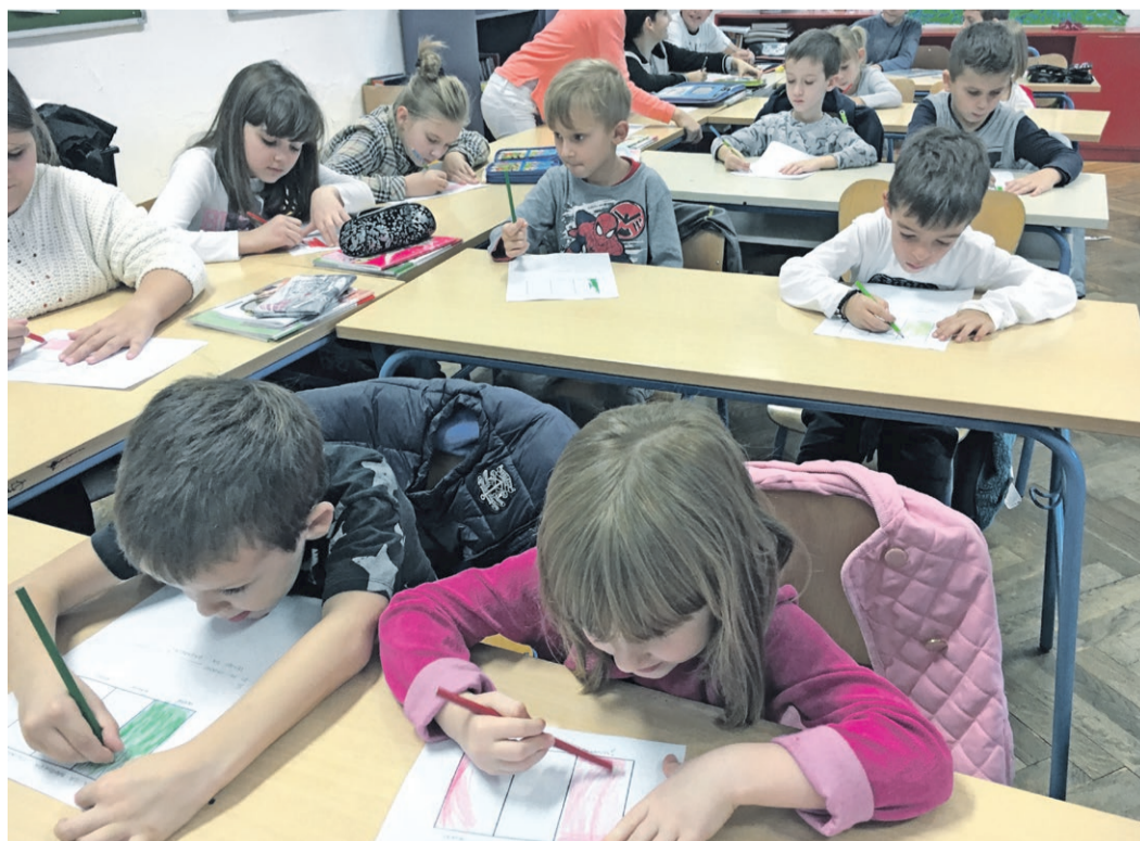
Za male prijatelje iz vrtića pripremljen je zanimljiv program ispunjen crtanjem, igrom i pjesmom

Osvješčivanjem različitosti i sličnosti među europskim zemljama i narodima u djece se razvija osjećaj prihvaćanja, bliskosti i zajedništva