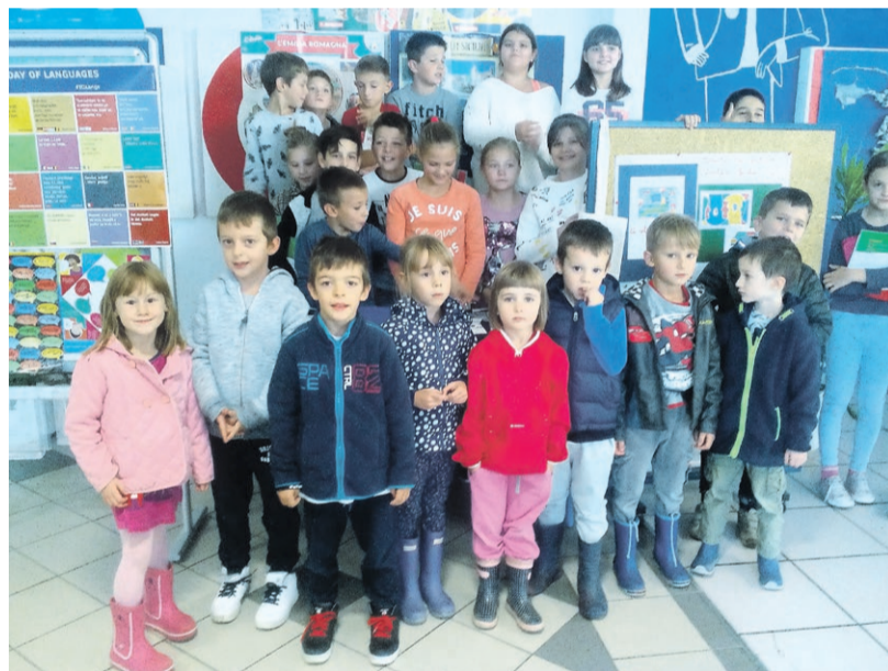
Djeca iz DV „Maksimir“ u posjetu učenicima OŠ A. G. Matoša u Zagrebu

Djeci dječjega vrtića to je bio prvi susret u ovoj školskoj godini u okviru projekta Suradnja s dječjim vrtićem „Maksimir“ . Cilj je projekta približiti djecu vrtićke dobi osnovnoj školi, ne samo učenju talijanskoga jezika, već i upoznavanju školskog sustava i ambijenta u kojem će nastaviti školovanje. Unutar projekta planirana su četiri posjeta: dva u osnovnoj školi i dva u vrtiću. Prva su dva posjeta za učenike osnovne škole, a vezana su i za teme građanskoga odgoja unutar domene višekulturnosti. Projektna nastava na taj način intenzivno živi za Europski dan jezika.